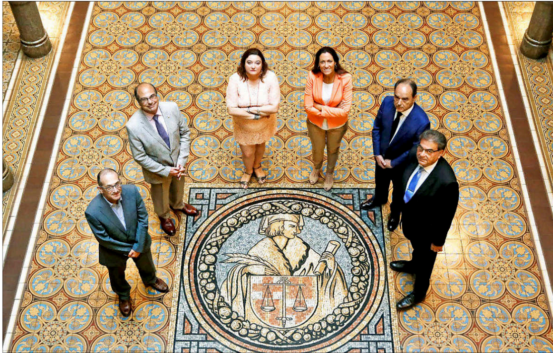
Los seis candidatos a decano del Colegio de Abogados de Barcelona posan para este medio en la sede de la corporación. ANTONIO MORENO